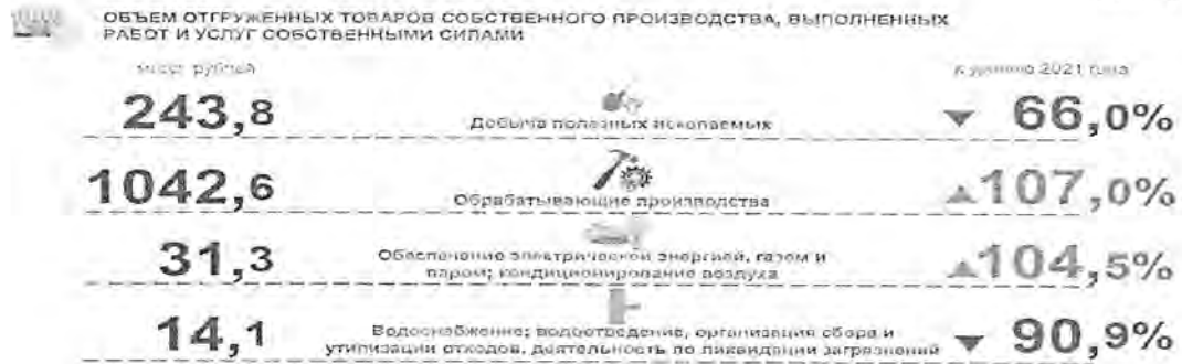
Диаграмма №1 12

Индекс промышленного производства по итогам 2022 года составил 100,0% (при прогнозе 102,5%), что на 0,6 процентных пункта выше показателя, сложившегося в целом по Российской Федерации (99,4% 13 ), по видам экономической деятельности «Добыча полезных ископаемых» - 96,4%, «Обработывающие производства» - 101,9%, «Обеспечение электрической энергией, газом и паром кондиционирование воздуха» - 97,9%, «Водоснабжение; водоотведение, организация сбора и утилизации отходов, деятельность по ликвидации загрязнений» - 83,7 %.